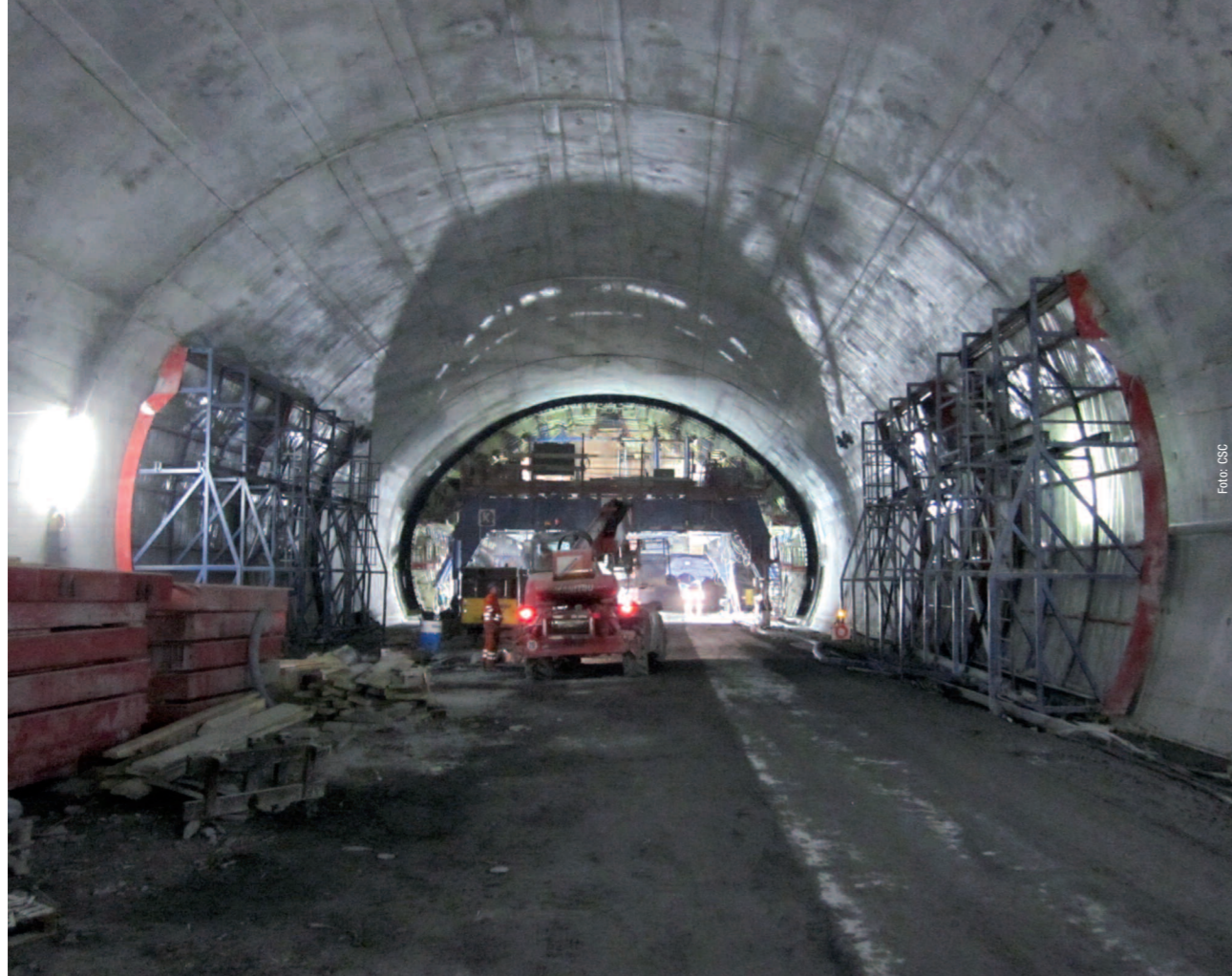
Lavori in corso presso il cantiere della galleria di Eyholz nei pressi di Visp.