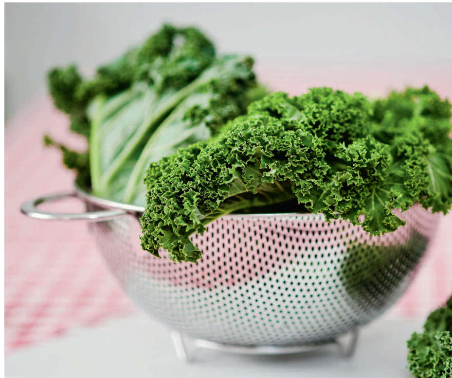
Roher Federkohl hat den höchsten Beta-Carotin-Gehalt (Vorstufe von Vitamin A) aller Lebensmittel, sogar noch mehr als Rüebli.

Ob in der traditionellen Küche oder in innovativen Gerichten – als Beilage oder Hauptgericht, roh oder gekocht – überzeugt der Federkohl in jeder Rolle. Das Allrounder-Gemüse kann auf viele verschiedene Arten zubereitet und genossen werden. Beispielsweise als knackiger Salat, würzige Suppe, nahrhafte Federkohlquiche oder als gesunder Snack in Form von Chips. Auch für grüne Smoothies wird er oft und gerne verwendet. Die Vielfalt und Auswahl an Rezepten ist zahlreich und bietet bestimmt für jeden Geschmack etwas.