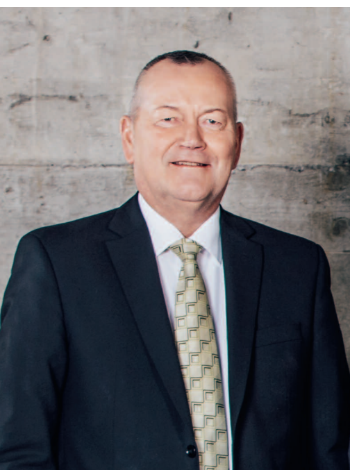
«I nostri premi saranno concorrenziali», afferma Urs Roth, CEO del Gruppo Visana.

Al momento, non è ancora possibile determinare l'aumento concreto. Al contrario degli anni passati, gli assicuratori non possono più pubblicare i premi provvisori in seguito a una nuova legge. Ciò significa che per voi i premi saranno disponibili al più tardi a inizio ottobre, dopo l'autorizzazione dell'UFSP. Tuttavia, sono ottimista che gli adattamenti dei premi in tutte le casse Visana – ovvero Visana, sana24 e vivacare – nel confronto di mercato saranno moderati e che potremo offrire premi concorrenziali sia per l'assicurazione di base sia per quanto riguarda le assicurazioni complementari. Inoltre, potrete continuare ad affidarvi alla nostra consueta qualità di prodotti e servizi.